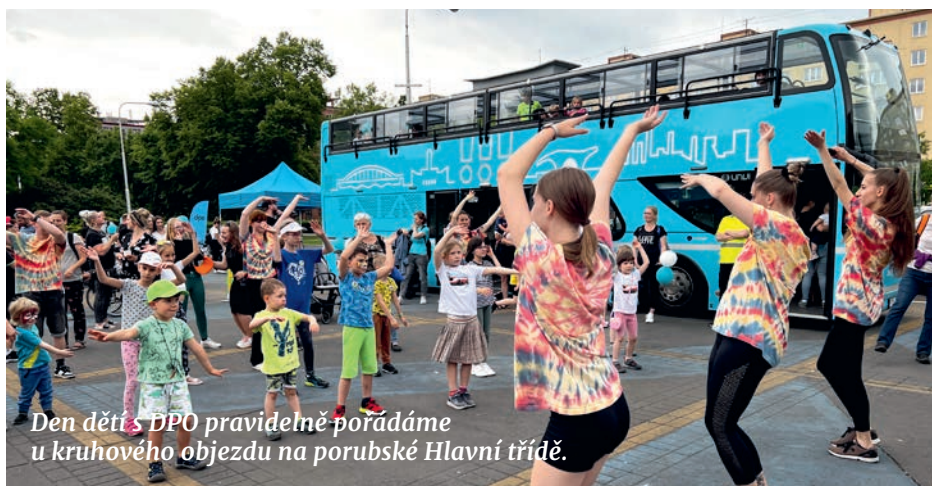
Den dětí s DPO pravidelně pořádáme u kruhového objezdu na porubské Hlavní třídě.