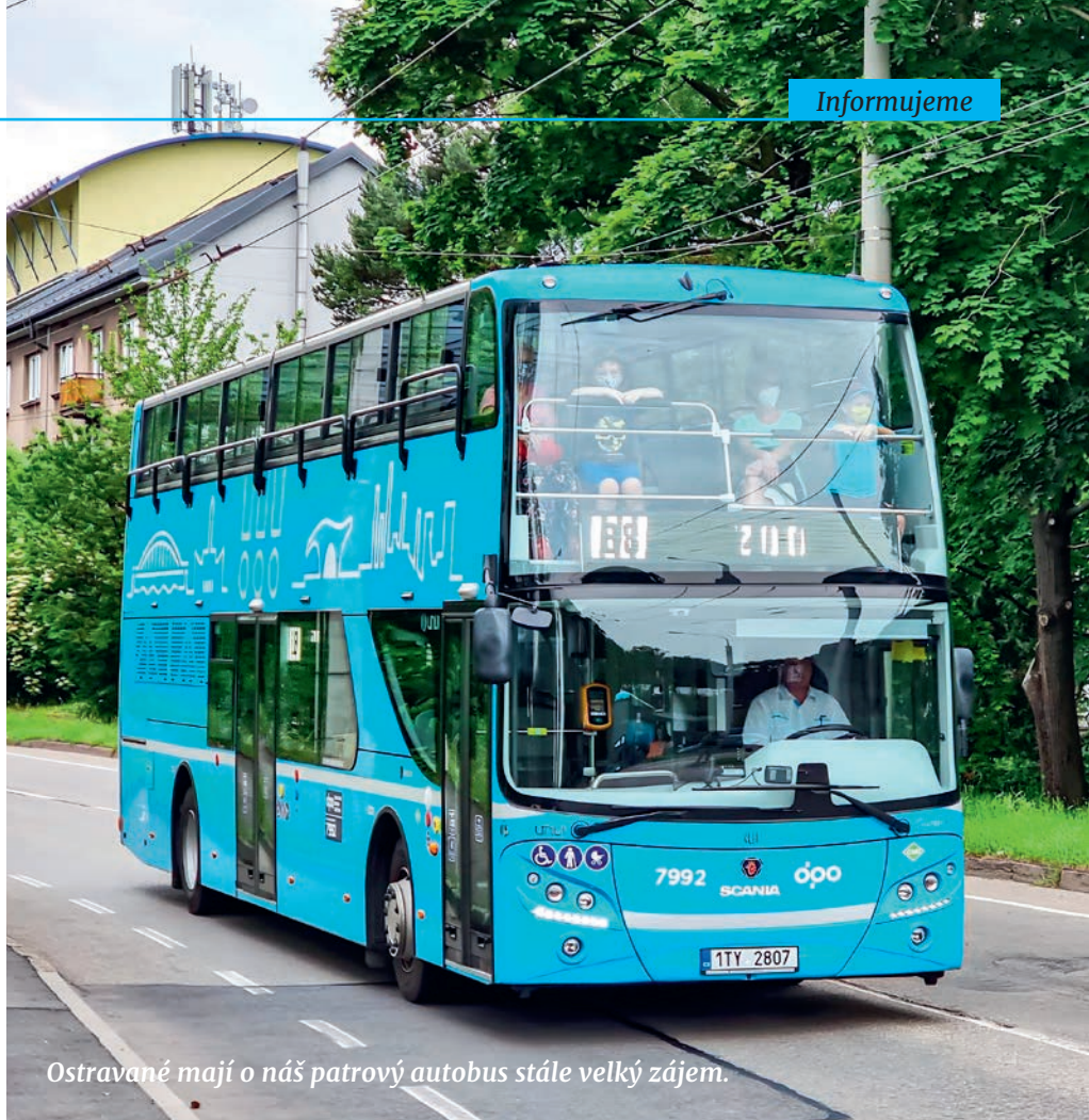
Ostravané mají o náš patrový autobus stále velký zájem.