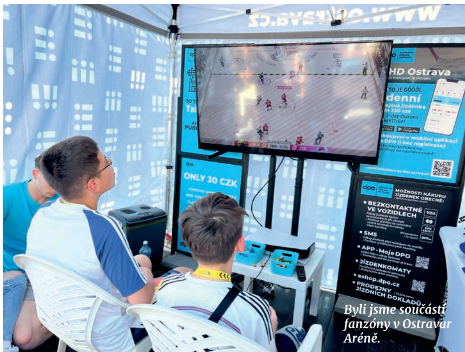
Byli jsme součástí fanzóny v Ostravě Aréně.

Kdo nechtěl využít zvýhodněnou hokejovou jízdenku, zvolil již tradiční možnost úhrady jízdného platební kartou ve voze. Z pohledu tohoto systému prodeje evidujeme v květnu prozatímni nejvyšší počet zakoupených kusů i tržbu v letošním roce, přičemž počet kusů přesáhl hranici 580 tisíc. Oproti průměrnému počtu prodaných jízdenek i tržbě letošního roku z bankovních karet se v květnu jedná o nárůst o více než dvanáct procent.