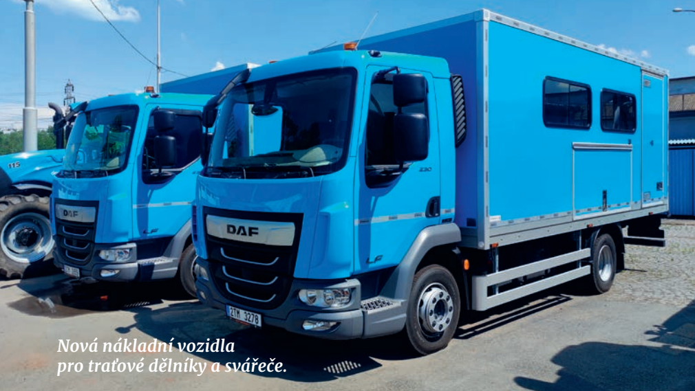
Nová nákladní vozidla pro traťové dělníky a svářeče.