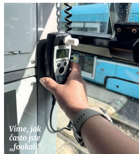
Víme, jak často jste „foukali“.

hodin kmenových řidičů a brigádníků. Automaticky se vyhodnocují odměny pro řidiče za sčítání cestujících. Sleduje se výprava elektrobusů a vyhodnocuje se, co stojí za případným nevypravením. Zda je to závada vozidel nebo nabíječek. Porovnávají se mezi sebou co do spolehlivosti jednotlivá dobíjecí místa (Valchařská x Hranečník x Svinov). Existuje sestava, která zpracovává požadavky na vyhledávání spojení v IDOSu. Z ní například plyne, že nejhledanějším cílem ze zastávky Hlavní nádraží je zastávka Karolina a ze zastávky Svinov, mosty je to Duha. Do budoucna chceme, až bude dořešeno