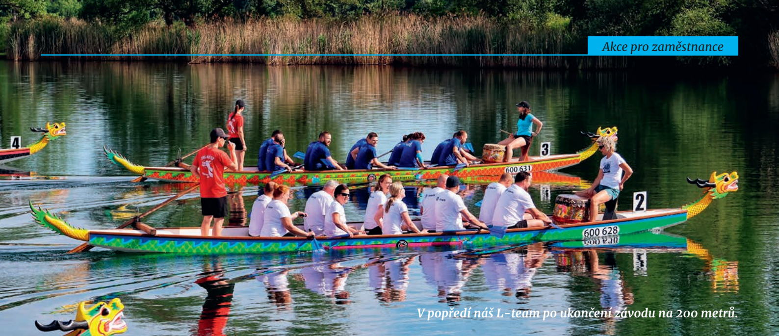
V popředí náš L-team po ukončení závodu na 200 metrů.