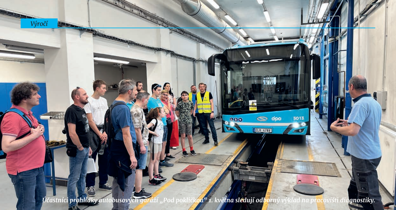
Účastníci prohlídky autobusových garáží „Pod pokličkou“ 1. května sledují odborný výklad na pracovišti diagnostiky.