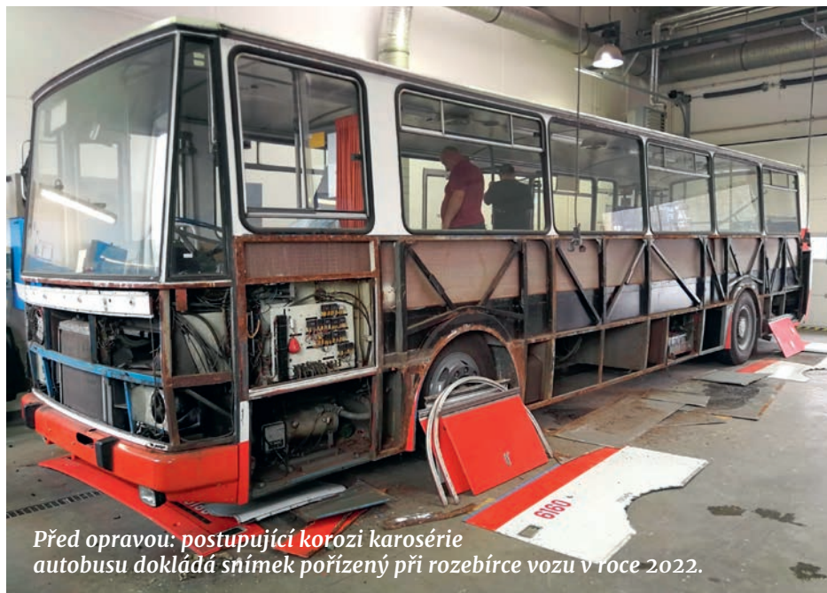
Před opravou: postupující korozi karosérie autobusu dokládá snímek pořízený při rozebrání vozu v roce 2022.

PC: Největším oříškem, který jsme zdárně rozlouskli, bylo zvládnutí opravy zatékání na místo řidiče u našich