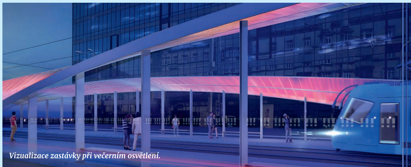
Vizualizace zastávky při večerním osvětlení.