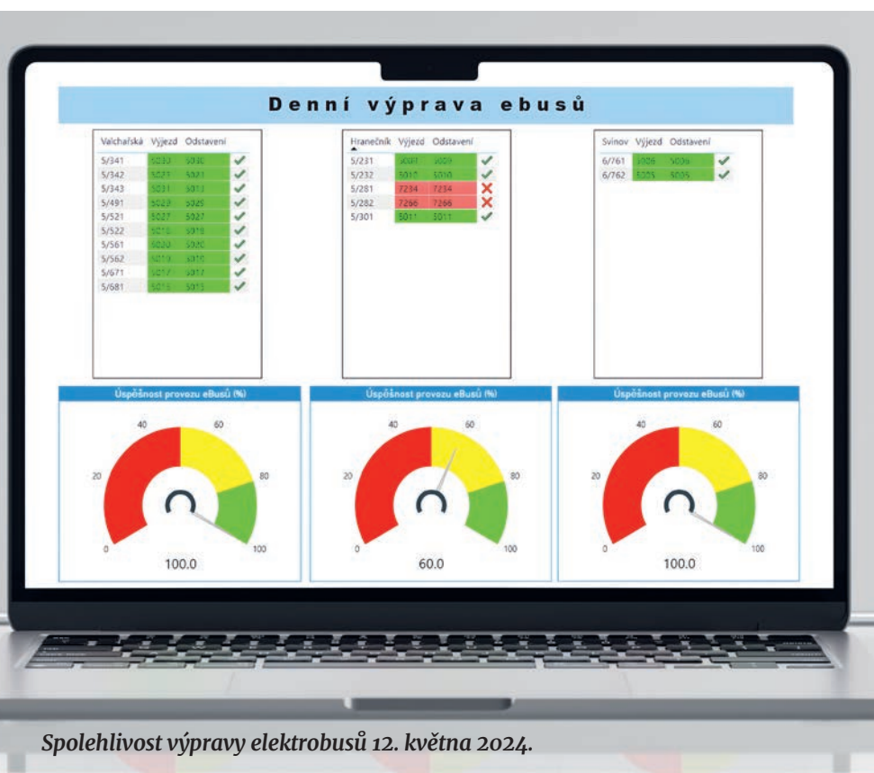
Spolehlivost výpravy elektrobusů 12. května 2024.

Softwarový produkt pro interaktivní vizualizaci dat umožňuje propojit a vizualizovat jakákoliv data a následně je vkládat do uživatelských aplikací. Jak nám „Béčko“ pomáhá? O tom je náš seriál.