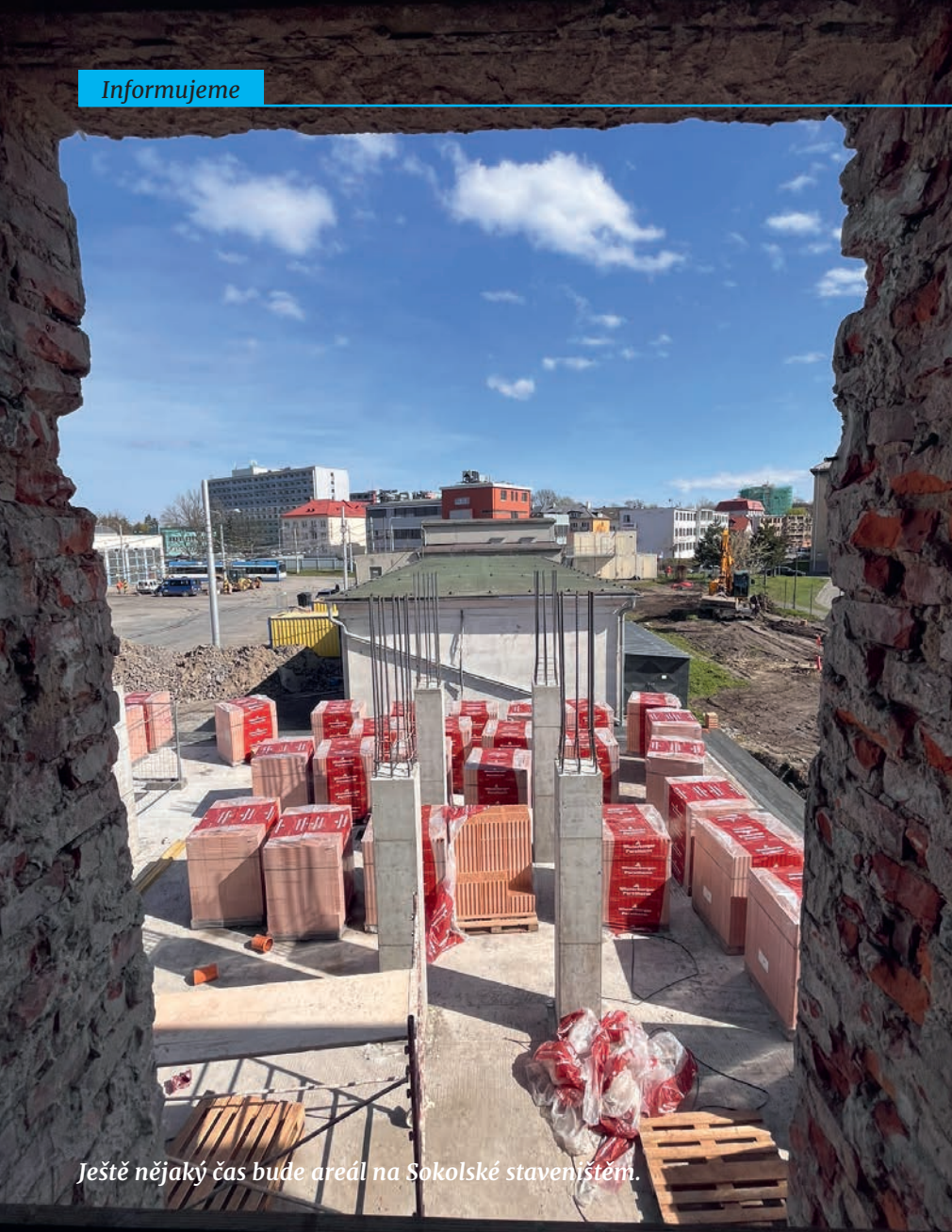
Ještě nějaký čas bude areál na Sokolské stavenišťem.