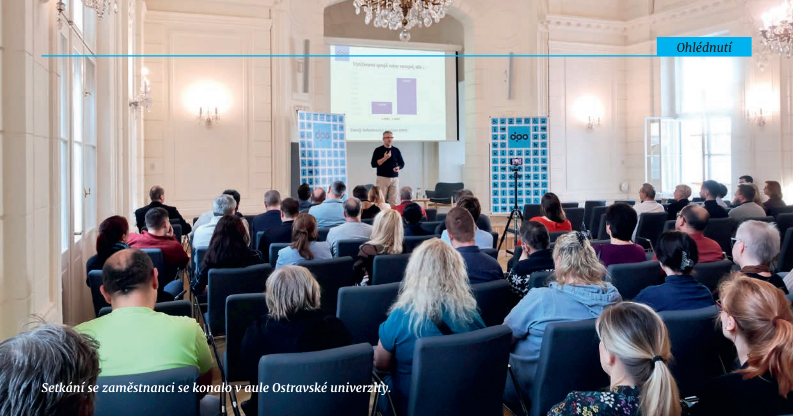
Setkání se zaměstnanci se konalo v aule Ostravské univerzity.