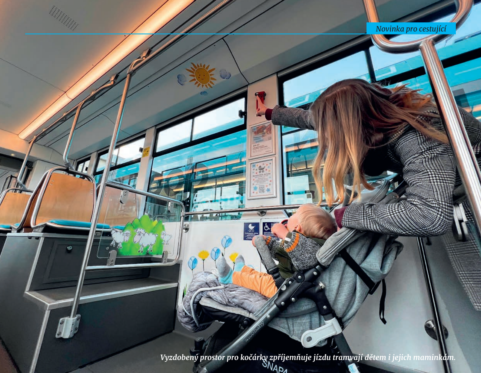
Vyzdobený prostor pro kočárky zpřijemňuje jízdu tramvají dětem i jejich maminkám.