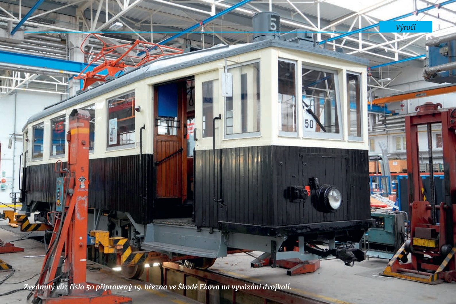
Zvednutý vůz číslo 50 připravený 19. března ve Škodě Ekova na vyvázání dvojkolí.