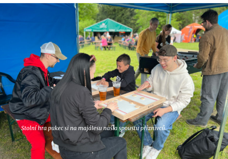
Stolní hra pukec si na majálesu našla spoustu příznivců.