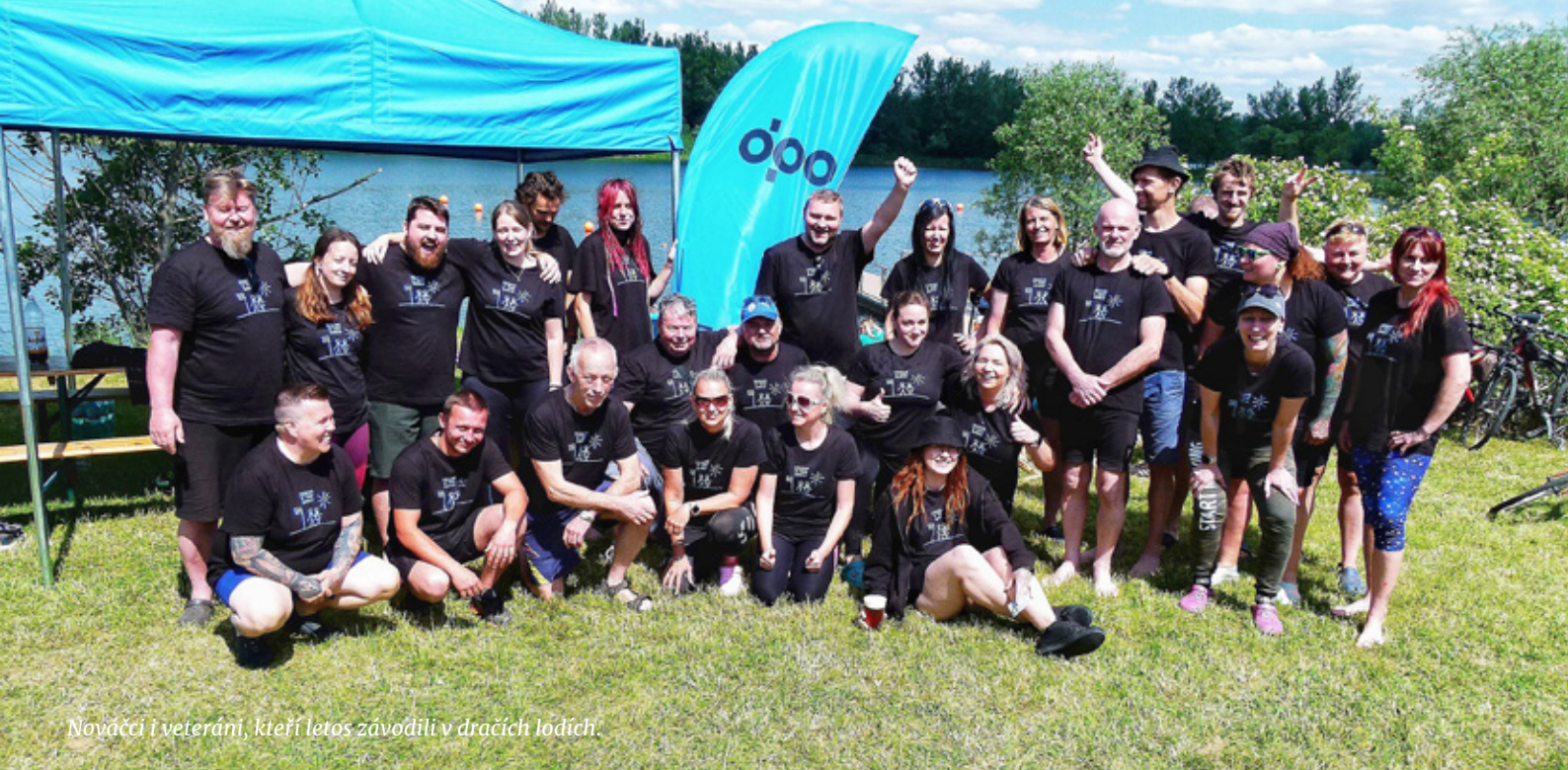
Nováči i veteráni, kteří letos závodili v dračích lodích.