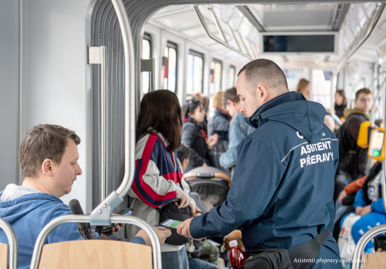
Asistenti přepravy opět v akci.