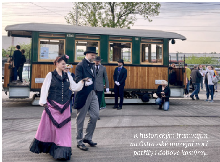
K historickým tramvajím na Ostravské muzejní noci patřily i dobové kostýmy.