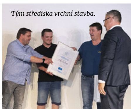
Tým střediska vrchní stavba.