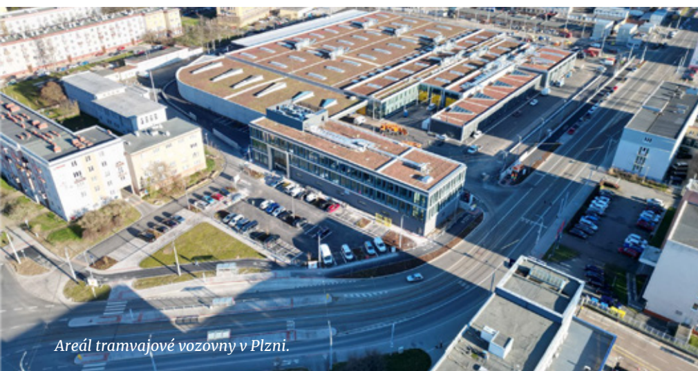
Areál tramvajové vozovny v Plzni.

50 mil. eur. Vozovna byla slavnostně otevřena v polovině března. Nabízí nesrovnatelně vyšší kvalitu technického vybavení včetně myčky tramvají s využitím dešťové vody nebo moderního podúrovňového soustruhu, průjezdné haly pro odstav tramvají o délce 124 metrů, nové zázemí pro zaměstnance a mnohem citlivěji je řešeno i její sousedství v těsné blízkosti obytné zóny.