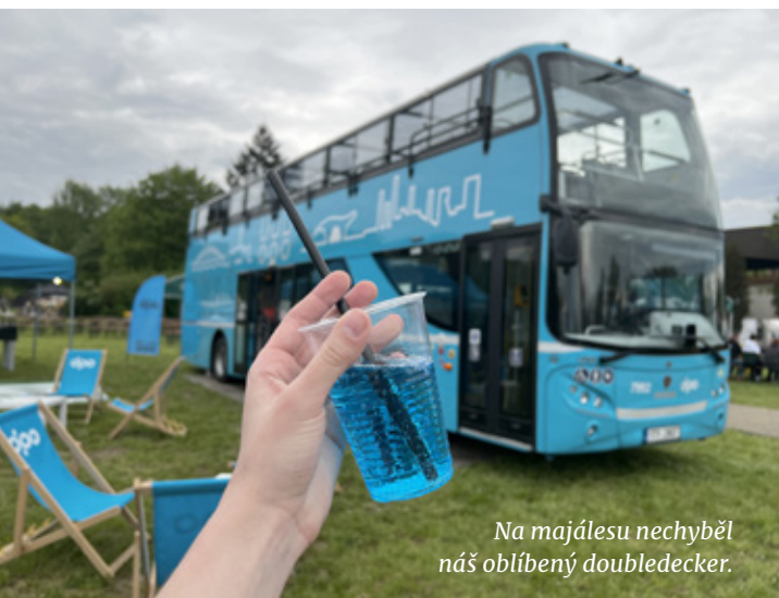
Na majálesu nechyběl náš oblíbený doubledecker.