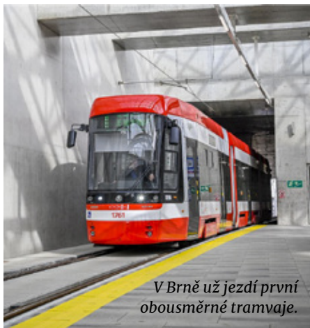
V Brně už jezdí první obousměrné tramvaje.

Dopravní podnik města Brna (DPMB) nakoupí další nové obousměrné tramvaje Škoda ForCity Smart 45T. Z Integrovaného regionálního operačního programu získal dopravce dotaci ve výši 630 milionů korun, která pokryje 70 % kupní ceny. Do konce roku 2025 bude v Brně jezdit celkem 20 nových obousměrných tramvají. K aktuálně dodávaným vozům totiž brzy přibude smlouva na dalších 15 kusů. Pořízení bude probíhat ve třech vlnách, vždy po pěti. První vozy chce DPMB nakoupit již během roku 2023, poslední várka by měla dorazit v první polovině roku 2025.