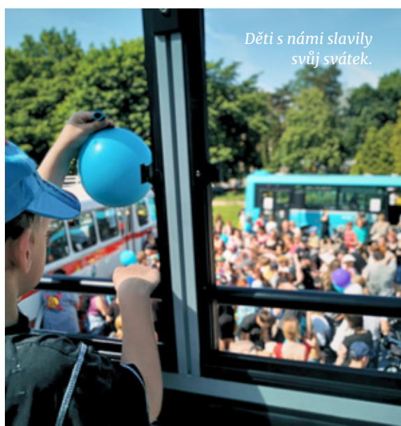
Děti s námi slavily svůj svátek.