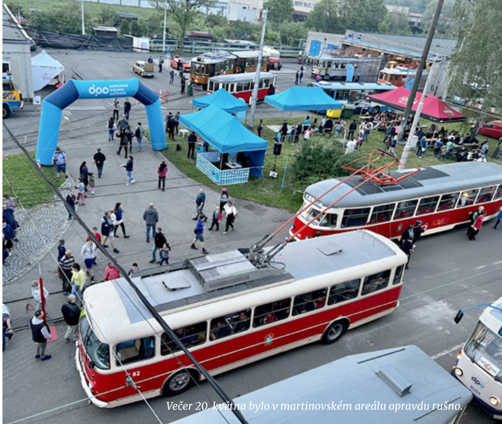
Večer 20. května bylo v martinovském areálu opravdu rušno.

Od 18. hodiny večerní začaly do prostranství u depozitáře historických vozidel proudit skupiny návštěvníků, kteří se i letos nechali zlákat naší „muzejní“ nabídkou. Ať už dorazili speciálním tramvajovým svozem z nejbližší zastávky u dílen, anebo přijeli spojem zvláštní autobusové linky „D“, mohli opět spatřit plejádu naleštěných historických tramvají autobusů a trolejbusů, účelně rozmístěnou ve vyhrazeném prostoru tak, aby se mohli mezi vozy volně procházet a třeba také udělat hezký snímek do rodinného alba. Komu ale nestačilo pouhé prohlédnutí, mohl se připojit k jedné z pravidelných komentovaných prohlídek a z úst zkušených průvodců vyslechnout nespočet zajímavostí z historie ostravské MHD. Celkový dojem pak umocnila