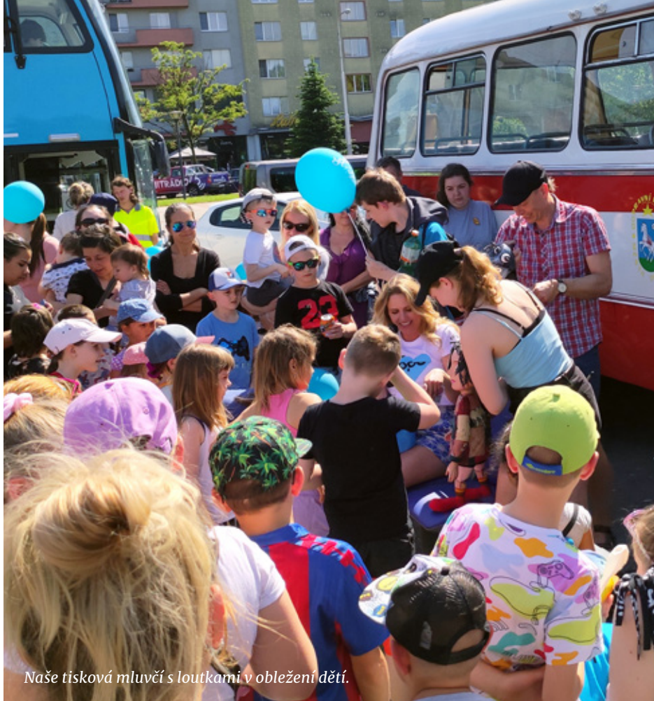
Naše tisková mluvčí s loutkami v obležení dětí.