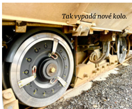
Tak vypadá nové kolo.