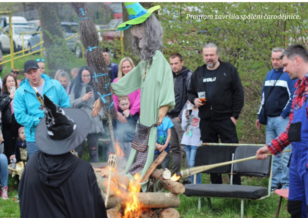
Program završilo spálení čarodějnice.

V sobotu 28. dubna se na hřišti dopravního podniku za krásného slunného počasí uskutečnila Filipojakubská noc aneb pálení čarodějnic 2023. Pro nejmladší účastníky byla připravena spousta zábavy, střílení ze vzduchovky a lukostřelba, skákací hrad, soutěž šikovnosti s pingpongovými míčky, skákání v pytlích, malování na obličeje a v neposlední řadě dopravní hřiště s motorovou čtyřkou. Zatímco se děti bavily, dospělí mohli posedět s kolegy a přáteli u bohatého občerstvení. Akci doprovázela hudba z 80. a 90. let. Na závěr byla spálena zlá čarodějnice. Ještě jednou děkujeme všem organizátorům a pořadatelům za pomoc při přípravách a zajištění.