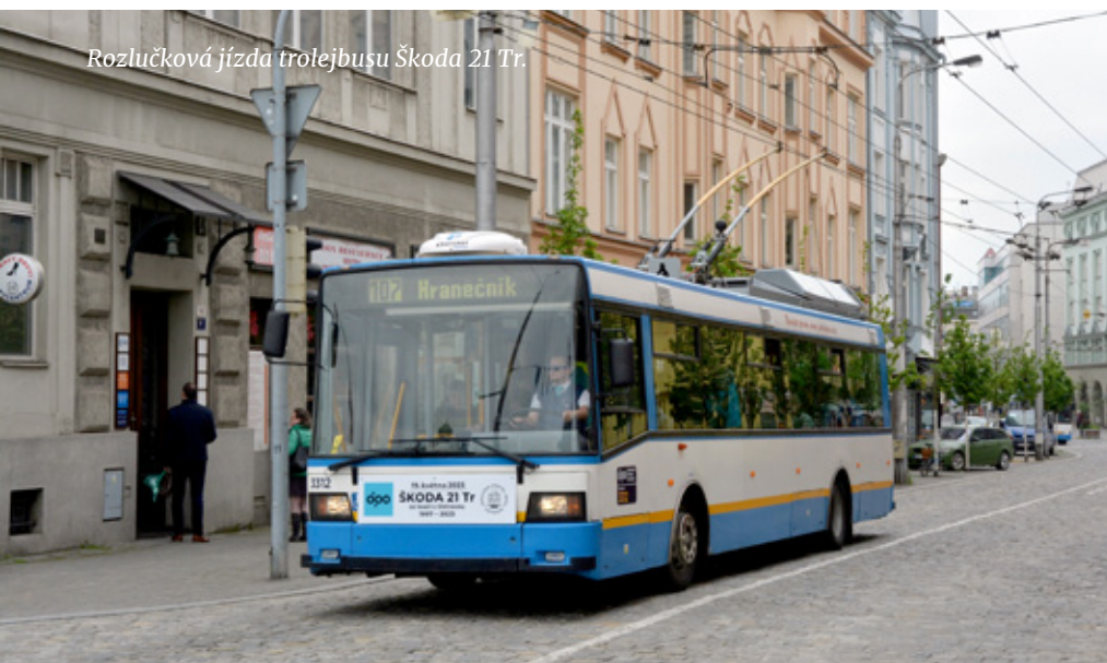
Rozlučková jízda trolejbusu Škoda 21 Tr.