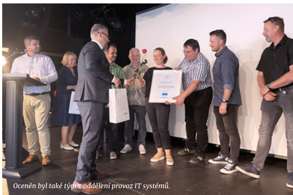
Oceněn byl také tým z oddělení provoz IT systémů.