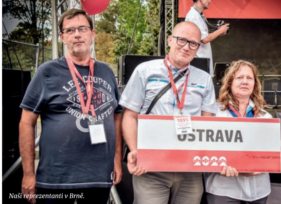
Naši reprezentanti v Brně.