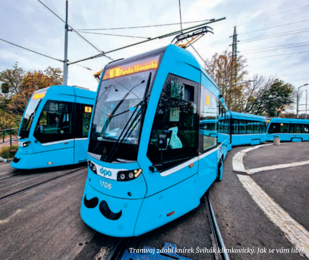
Tramvaj zdobí knírek Švihák klimkovický. Jak se vám líbí?

Movember je pravidelná charitativní akce zaměřená na prevenci rakoviny u mužů, do které se společně s řadou dalších dopravních podniků moc rádi zapojujeme. Listopad je tedy i pro nás měsícem mužské soli-