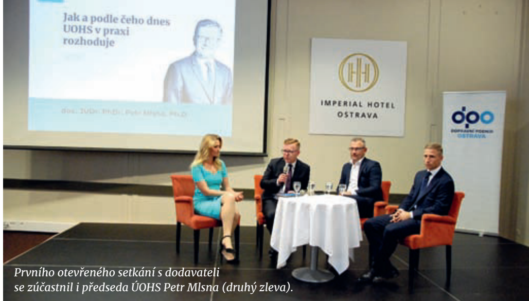
Prvního otevřeného setkání s dodavateli se zúčastnil i předseda ÚOHS Petr Mlsna (druhý zleva).

„Jsem rád, že se nám podařilo toto výjimečné setkání zorganizovat. Transparentnost je pro nás klíčová a chtěli jsme nejen pro český trh deklarovat, že naše výběrová řízení jsou otevřená pro každého. Stojíme o to, aby o naše zakázky usilovalo co nejvíce subjektů za spravedlivých podmínek. Společné setkání a dialog je dalším krokem na naší cestě k co největší transparent-