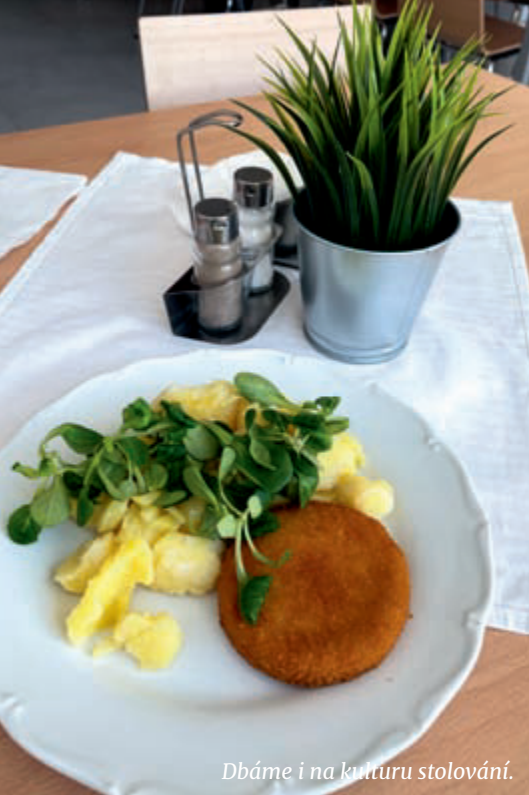
Dbáme i na kulturu stolování.

Rád bych vám představil, co se nám již podařilo, na čem pracujeme a co bychom rádi do budoucna změnili. Především se nám povedlo stabilizovat kuchyň, aby její provoz odpovídal všem platným předpisům a normám. Stabilizovali jsme BOZP, přípravu