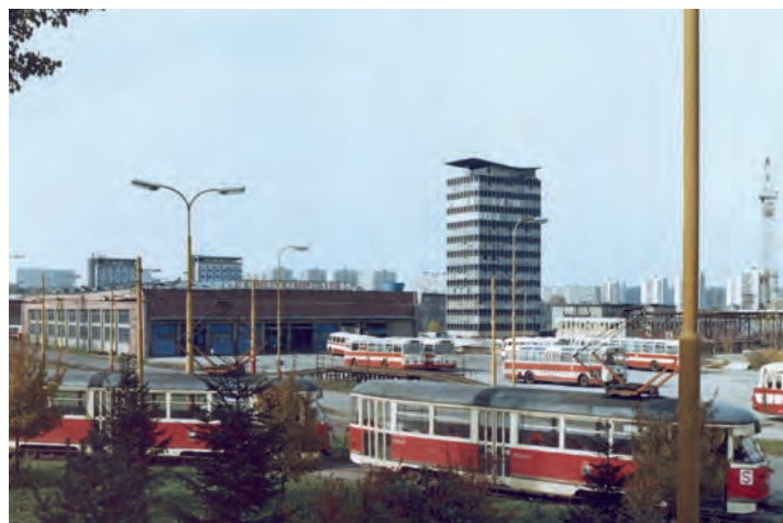
Snímek pořízený rovněž v roce 1977 dokumentuje původní stav jednolodní odstavné haly a zadní zpevněné plochy ještě bez krycích přístřešků

Tomuto bouřlivému rozvoji však nepostačovaly jediné autobusové garáže situované na Sládkově ulici poblíž centra. Nejprve proto byla v roce 1968 adaptována pro autobusový provoz bývalá vozovna úzkorozchodných tramvají na Hranečníku a v roce 1970 také objekt tramvajových dílen. V oblasti Poruby byly již od roku 1966 pro odstavování autobusů využívány rovněž okrajové zpevněné plochy v areálu tramvajové vozovny. Proto padlo rozhodnutí vybudovat třetí autobusovou provozovnu právě zde. Byla umístěna do severovýchodní části areálu, kde byl původně plánován nerealizovaný samostatný objekt denní údržby tramvají s mycí linkou a zařízením pro doplňování písku do vozů.