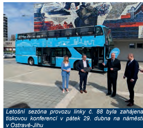
Letošní sezóna provozu linky č. 88 byla zahájena tiskovou konferencí v pátek 29. dubna na náměstí v Ostravě-Jihu