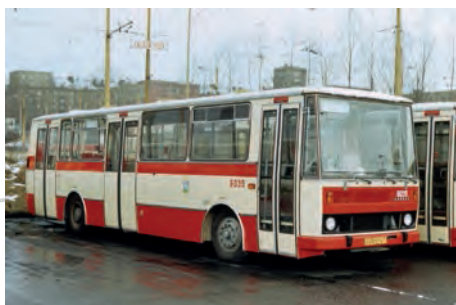
V roce 1982 obdržel ostravský dopravní podnik první autobusy nového typu Karosa B 731. Vedle hranaté karoserie s výklopnými dveřmi bylo zásadním rozdílem oproti vozům ŠM 11 umístění hnacích agregátů za zadní nápravou. Na snímku pořízeném v lednu 1983 v garážích Poruba je nový autobus číslo 6035 před prvním nasazením do provozu