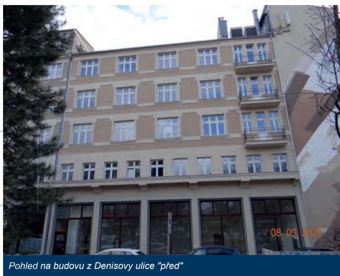
Pohled na budovu z Denisovy ulice "před"