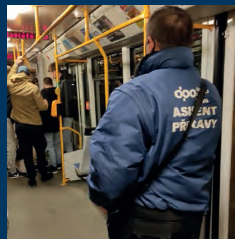
Asistenti přepravy vyloučili při noční akci z 8. na 9. dubna celkem 185 pasažérů (13%)