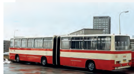
Po provedených opravách obdržely autobusy Ikarus nátěry v několika různých barevných provedeních. Tento „porubský“ vůz byl opatřen slušivým nátěrem s krémovým pruhem vycházejícím z běžné kombinace používané u městských autobusů