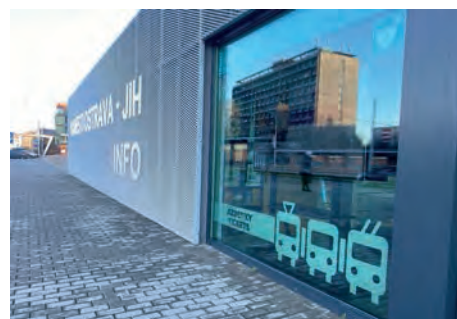
Prodejna Info JIH!!! na nám. v Ostravě-Jihu zcela nahradila naši prodejnu v obchodním centru Venuše

„Bezbariérový vstup do prodejny, kvalitní