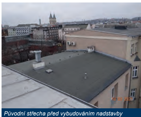
Původní střecha před vybudováním nadstavby