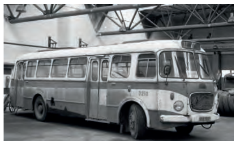
Tento dílenský vůz garáží Poruba označený jako D210 byl původně městským autobusem Jelcz MEX 272E číslo 505. Vyroben byl v roce 1974, do provozu v Ostravě byl zařazen o rok později a v osobní dopravě sloužil do roku 1982. Jako dílenský se používal dalších šest let