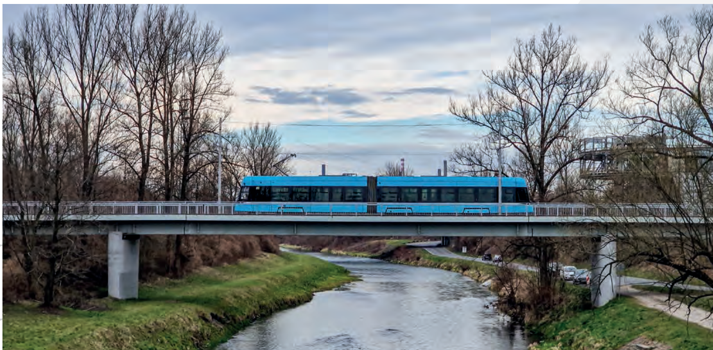
Díky pravidelnému provozu získáváme cenná data a zkušenosti, které povedou k upgradu řídicího SW tramvaji Škoda