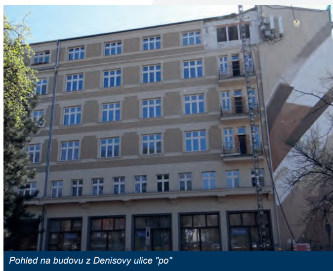
Pohled na budovu z Denisovy ulice "po"