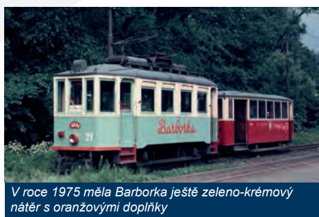
V roce 1975 měla Barborka ještě zeleno-krémový nátěr s oranžovými doplňky

stejných evidenčních čísel dodaných do Ostravy z Královopolské strojírny v roce 1905. Tyto vozy byly původně určeny pro provoz na prodloužené trati z Hulváku do Svinova, která měla v místech tzv. Hulváckého kopce maximální sklon až 77,3 ‰. Oproti dříve dodaným motorovým vozům měly tyto čtyři vozy poněkud menší rozměry, a tím také obsaditelnost, neboť jejich celková hmotnost byla omezena nízkou únosností mostu přes Odru v Nové Vsi. Právě tyto nevyhovující provozní parametry byly z největší pravděpodobnosti příčinou jejich předčasného vyřazení již po 16 letech provozu a nahrazení novými kapacitními