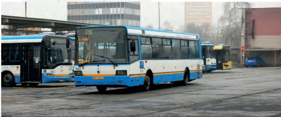
Do porubských garáží příslušely rovněž dva nízkopodlažní autobusy Škoda 21Ab unifikované s tehdy vyráběným trolejbusem Škoda 21Tr. Oba vozy byly pořízeny v roce 1997 a v provozu se udržely do roku 2008, kdy byly zejména pro nedostatečný výkon motoru vyřazeny a následně prodány do maďarského Szegedu

V současné době mají garáže Poruba ve stavu pro osobní dopravu celkem 125 autobusů, z toho je 82 standardních o délce 12 metrů, 6 desetimetrových, 35 článkových a 2 minibusy. Převážná většina těchto vozů má ekologický pohon na CNG. Dále zde přísluší také dva elektrobuses s technologií opportunity charging, umožňující ultrarychlé dobíjení trakčních baterií. Kromě autobusů pečují garáže také o všechna osobní a technologická vozidla DPO. Z důvodu požadavku na uvolnění stávajících pozemků pro další výstavbu se v následujících letech předpokládá přemístění garáží Poruba do areálu dílen DPO v Martinově.