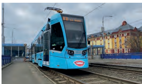
Nejvíce hlasů v anketě obdržela pusinka „koketa“

Dlouhé řasy a pusinky již potřetí zdobily naše tramvaje „dámským obličejem“. Zkrášlené tramvaje Stadler byly v ostravských ulicích k vidění od úterý 8. března, a opět tak připomněly Mezinárodní den žen. Ženy, dámy a dívky, které ten den cestovaly ostravskou MHD, jsme potěšili květinou v podobě tulipánu. Cestující i letos mohli hlasovat v anketě, která pusinka na „štádlerce“ je nejhezčí. Ozdobné rty šesti různých tvarů byly označené jako