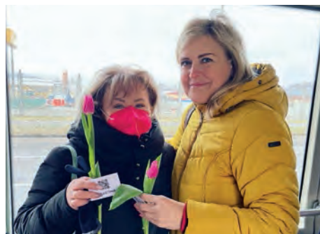
Spokojené cestující obdarované tulipány

„krasavice“, „koketa“ nebo „stydlička“ a další. Nejvíce hlasů v anketě obdržela právě „koketa“. „Chceme všem ženám, cestujícím i našim zaměstnankyním touto cestou poděkovat. Jsme přesvědčeni, že ženy si právě takový svátek zaslouží. I konkrétně v DPO mají ženy významnou pozici. Podíl žen mezi řidiči je 25 %, to je nejvíce ze všech velkých dopravních podniků