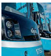
Tramvaje Škoda 39T jsou nové v provozu ostravského dopravního podniku.