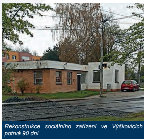
Rekonstrukce sociálního zařízení ve Výškovicích potrvá 90 dní

Zázemí řidičů a pracoviště manipulantek na smyčce ve Výškovicích slouží v nezměněné podobě již desítky let. Za tu dobu budova jak fyzicky, tak morálně zastarala a přestává vyhovovat současným provozním nárokům a potřebám zaměstnanců. O nutnosti oprav se bavíme již řadu let, v letošním roce můžeme konečně přikročit k jejich uskutečnění. Na přelomu dubna a května byla jako součást programu zlepšování pracovního prostředí