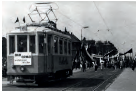
První veřejná prezentace Barborky proběhla v čele prvomájového průvodu ostravských dopravedů v roce 1965

V provozu s cestujícími byl motorový vůz číslo 21 do května 1964 a od října téhož roku byl převeden mezi služební vozy. Podobně jako se tak stalo předtím např. v Praze nebo Ústí nad Labem, padlo i v Ostravě rozhodnutí upravit některý z vozů na tramvaj mateřských škol. Volba padla právě na motorový vůz číslo 21. V oddíle byla upravena zvýšená podlaha pokrytá gumovým kobercem, ve schůdkách pro snadnější nástup a výstup dětí přibyl