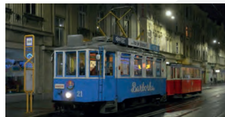
Současný stav tohoto vozu dokumentuje snímek pořízený na zastávce Stodolní s vlečným vozem číslo 219 při loňských adventních jízdách