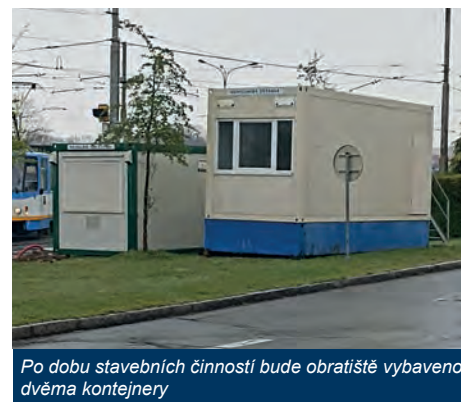
Po dobu stavebních činností bude obřitiště vybaveno dvěma kontejnery