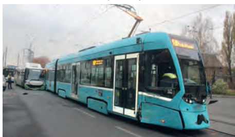
Dopravní nehoda ze dne 9. 11. 2021, křižovatka ulic Nádražní x Špálava, kdy se řidič autobusu cizího dopravce chtěl otočit a při tom přehlédl souběžně jedoucí tramvaj a došlo ke střetu se zraněním obou řidičů - cizí vina, odhadnutá škoda celkem 2,5 mil. Kč

Stále se opakující příčinou vzniku dopravní nehody z vlastní viny řidiče MHD byla