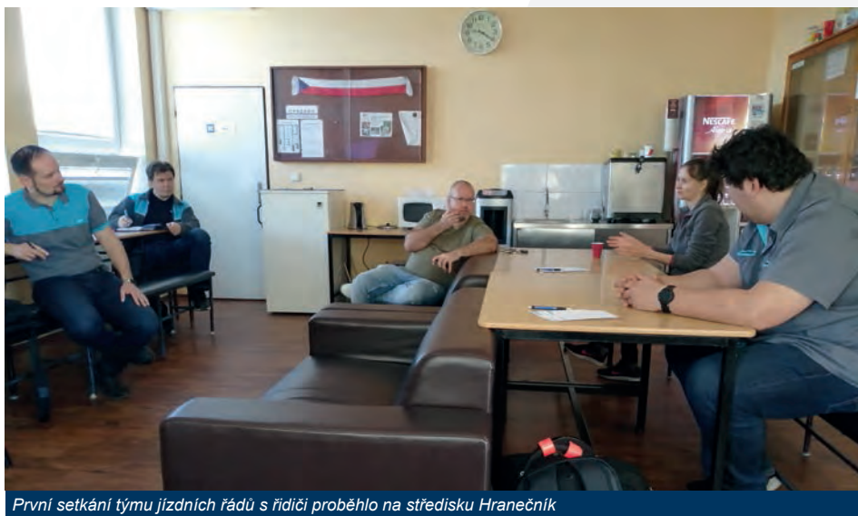
První setkání týmu jízdních řádů s řidiči proběhlo na středisku Hranečník