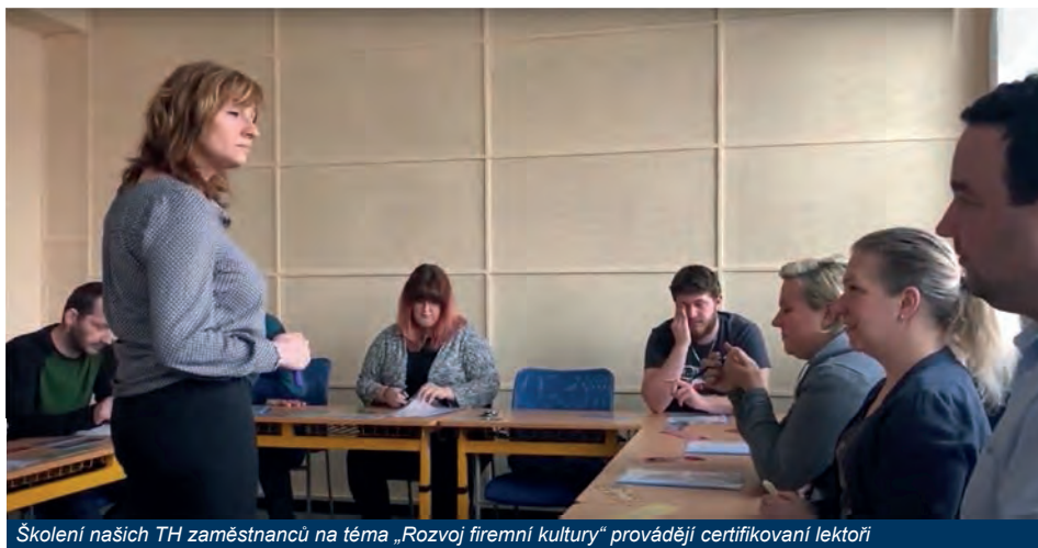
Školení našich TH zaměstnanců na téma „Rozvoj firemní kultury“ provádějí certifikovaní lektori

Vážené kolegyně a kolegové, v letošním roce jsme se vydali na cestu uceleného firemního vzdělávání a odstartovali velký projekt „Rozvoj firemní kultury - Jedeme v tom spolu 2025“. Ptáte se, co nám to přinese?