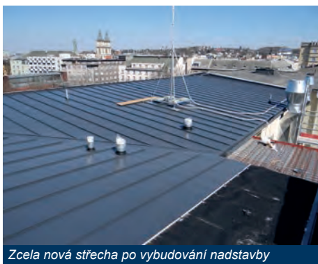
Zcela nová střecha po vybudování nadstavby