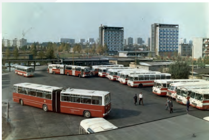
Pohled na nádvoří před halou lehké údržby s odstavenými autobusy v roce 1977. Uprostřed snímku první dva článkové autobusy Ikarus 280.08 číslo 4001 a 4002