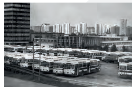
Zadní nádvoří Garáží Poruba kolem roku 1978. Na záběru vidíme v podstatě všechny tehdejší provozované typy autobusů – Škoda 706 RTO, Jelcz MEX 272E, Karosa ŠM 11, Karosa ŠL 11 a Ikarus 280

tomusů. Navyšování počtu přidělených autobusů si na konci 70. let minulého století vynutilo změnu určení této haly. Po vybavení patřičnou technologií slouží pro těžkou údržbu, jako například opravy vozidel po nehodách, opravy karoserií a výměny agregátů. V obou halách proběhly v roce 2015 úpravy umožňující provádět v těchto prostorách opravy autobusů s pohonem CNG. V areálu garáží je dále čerpací stanice PHM, vrátnice s dispečinkem, kanceláře a sociální zařízení řidičů a zpevněné plochy pro odstavování autobusů. Pro zamezení úniku ropných látek byla v roce 1993 venkovní autobusová stání rekonstruována a doplněna o ocelové přístřešky. S krátkým přerušením v letech 1972 až 1977 je část „porubských“ auto-