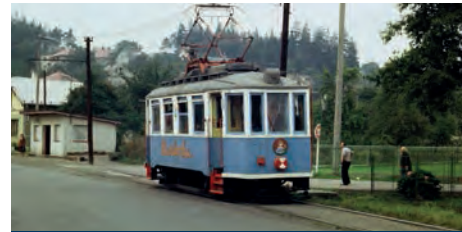
O několik let později se nátěr změnil na modro-krémový, oranžové doplňky však zůstaly

další stupeň a interiér vozu byl opatřen pestrobarevným nátěrem a výjevy z pohádek a večerníků. Vnější lak byl v té době světle zelený s krémovou okenní částí a oranžovými doplňky. Premiéru měla Barborka 1. května 1965, kdy s nápisem „Dar DPMO mateřským školám“