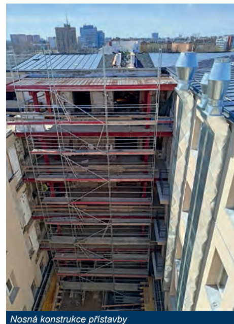
Nosná konstrukce přístavby