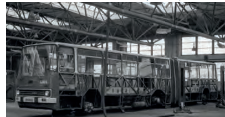
Na snímku z ledna 1983 vidíme na hale těžké údržby probíhající opravu karoserie na prvním autobusu Ikarus 280 číslo 4001. Vůz byl v té době již za polovinou své životnosti, neboť byl z provozu vyřazen v roce 1986

busů v nočních hodinách a mezi dělenými směry odstavována v areálu dílen v Martinově. Podobně byla mezi lety 1992 až 1998 využívána k odstavování vozů rovněž smyčka Opavská.