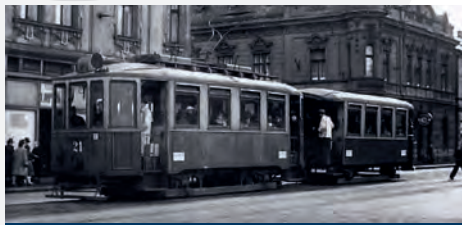
Motorový vůz 21 s vlečným vozem ze série 69 až 72 na lince číslo 1 na dnešním náměstí Svatopluka Čecha v období 2. světové války

Vyroběn byl společně s vozy číslo 18 až 20 v dílnách Moravsko-ostavské místní dráhy v roce 1922, jako náhrada za původní vozy