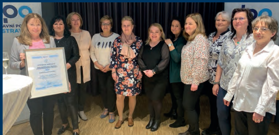
Letošní novinku, cenu pro kolektiv, získaly pracovnice oddělení řízení pohledávek