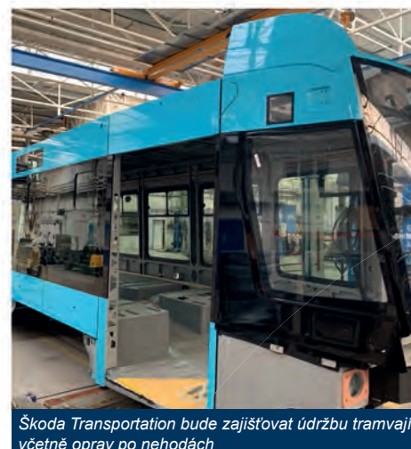
Škoda Transportation bude zajišťovat údržbu tramvají včetně oprav po nehodách