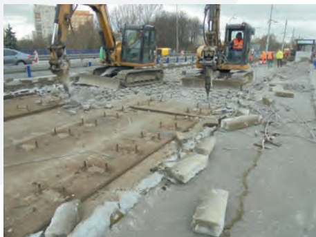
Oprava mostu č. 5-020 na ul. Plzeňská je finančním rozsahem menší stavba, avšak technologicky velmi komplikovaná

Co do finančního rozsahu se jedná, v porovnání s ostatními úseky modernizovaných tramvajových tratí, o menší stavbu, avšak vzhledem k technologicky náročným úpravám